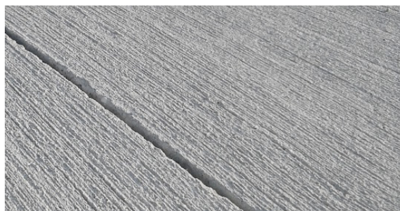
Detalhe do Sistema STD SELECT